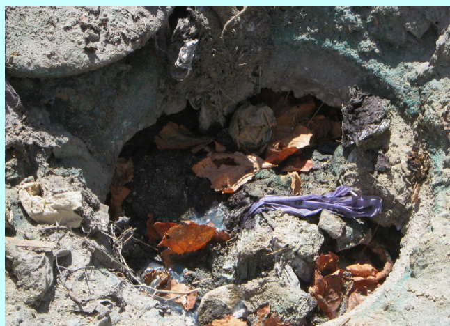
Fosa Séptica Expuesta y Llena