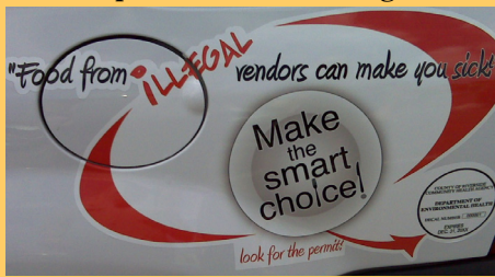
Vehiculo de Environmental Health