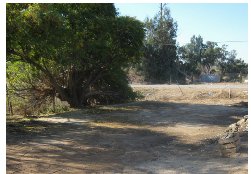
Arriba: Estructura que poseia peligro Abajo: Limpia y segura