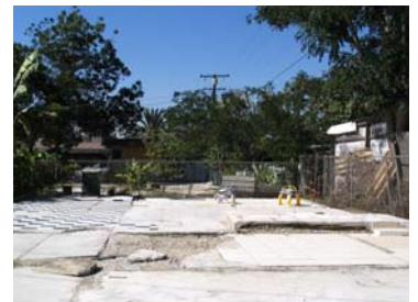
El propietario derribó esta estructura ilegal