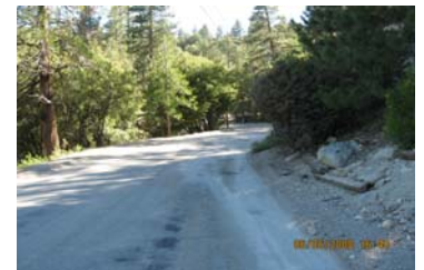
Esta área tuvo un derrame grave de cemento