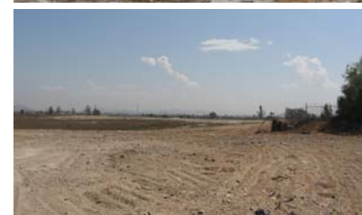
Se limpió una propiedad que poseía bienes raíces