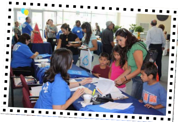
Nuestros vecindarios comienzan con nuestras familias. Por lo cual todos eran bienvenidos en la Conferencia de Vecinos.