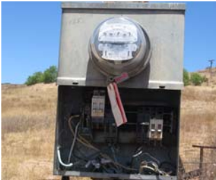
Manipulando el medidor eléctrico puede llevar a fuego, heridas, o a la muerte